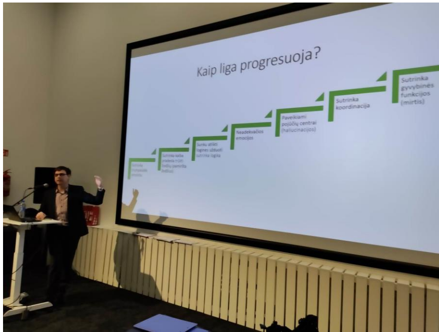
Aiškinama Alzheimerio ligos eiga ir progresavimas